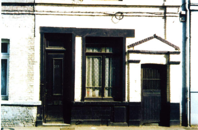
Notre Dame des Victoires, dont le culte remonte au 17e siècle.

Une appellation triomphante pour ce discret oratoire inséré dans une maison de 1905, au 251 rue du Général de Gaulle.