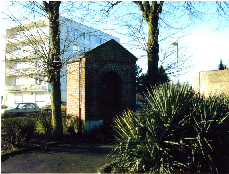
Deux beaux tilleuls montent la garde autour de la chapelle Sainte Thérèse.

La plus ancienne de nos chapelles aurait été construite en 1890 au bout de la rue Hoche aujourd'hui disparue, au lieu-dit « La Goulette », appelé ainsi en raison de l'existence d'un ruisseau, sur un terrain appartenant à la famille Paquet-Scoutteten. Les constructions du siècle dernier ont bouleversé le paysage urbain et, si l'oratoire n'a pas bougé, les noms de certaines rues ont changé : c'est à l'angle des actuelles avenue René Coty et rue Faidherbe qu'on le trouve aujourd'hui.