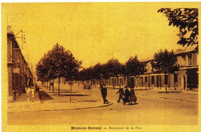
Mons-en-Barœul — Boulevard de la Paix

Les Allemands allaient arriver. C'est là que je les ai vus pour la première fois. C'était le début de l'après-midi. Un soldat est entré chez Mme Lefebvre. Il lui a demandé à boire. Elle lui a proposé un verre d'eau, qu'il lui a fait goûter avant de boire. Nous sommes sortis. Les soldats qui arrivaient de Flers par l'école Pasteur, avançaient en file indienne de chaque côté du boulevard de la Paix et s'en allaient vers Fives, comme à la promenade. Plus tard nous avons entendu la canonnade, vers Loos et Haubourdin il me semble.